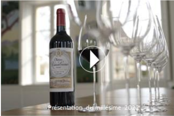
Présentation du millésime 2022