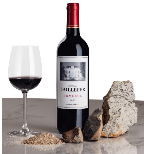
Silica, iron oxide, grave and blue clay compose the terroir of Château Taillefer

Located on the plateau of Pomerol, Château Taillefer is named after a specificity of the appellation, the iron oxides. The elders recount that the plow "carves iron" ( "taille le fer" in french ) given the amount lifted in this vineyard.